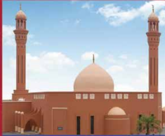
مسجد بدر الميلم